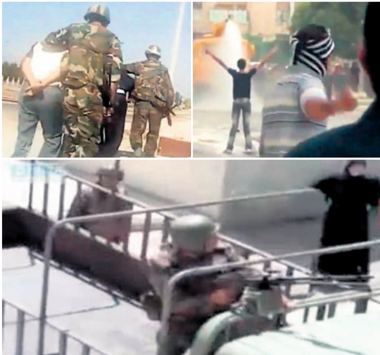
Weil ausländischen Journalisten die Einreise verweigert wird, gibt es kaum professionelle Bilder der Proteste in Syrien. – Die Bilder im Uhrzeigersinn: Verhaftung von Demonstranten in Homs, Strassenkampf in Hama, Soldat an unbekanntem Ort in Syrien. key

Die Opposition hat bisher zwei Konferenzen in der Türkei abgehalten. Was sind die wichtigsten Forderungen?